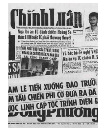
Timeline of Paracel (Hoang Sa) and Spratly (Truong Sa) Islands Dispute

Tài liệu dịch thuật, mời xem chi tiết tại http://hoangsa.org/forum/showthread.php?t=2453